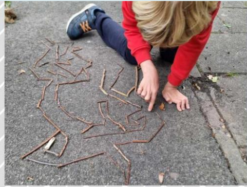
een doolhof voor

Uiteraard werden alle kriebeldiertjes daarna terug veilig in de natuur losgelaten. (Al heb ik horen waaien dat sommige kindjes het ook meenamen naar huis als huisdiertje 😊)