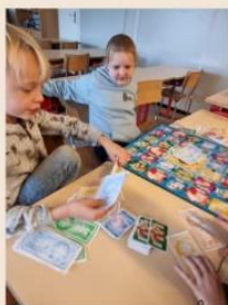
gezelschapsspelletjes - pomponnen - drama