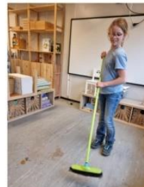
journalistiek en schoonmaken