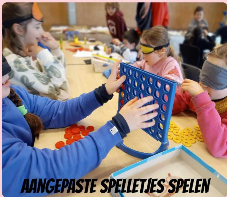
AANGEPASTE SPELLETJES SPELEN