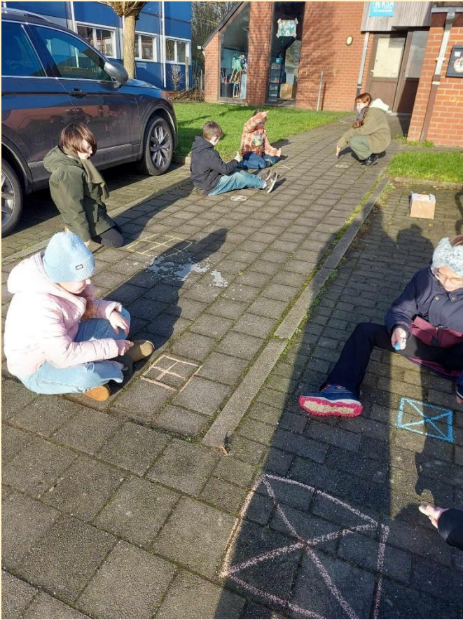
outdoor oefening breuken