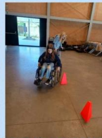
BELEVINGSPARCOURS MET ROLSTOEL