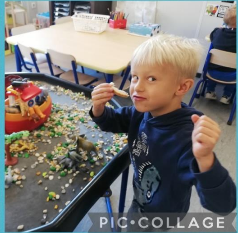
Hoekenwerk en zakjestijd