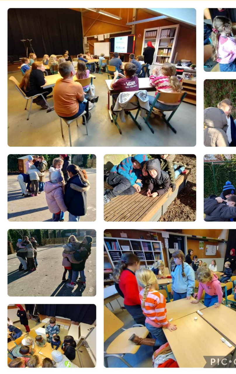
ILS lessen rond eenzaamheid