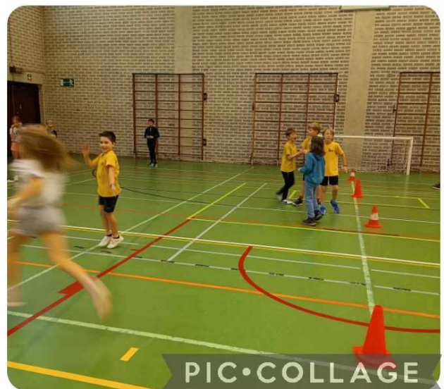
Onze vosjes in actie tijdens het trefbaltornooi.