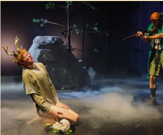
toneel "Oh Deer"