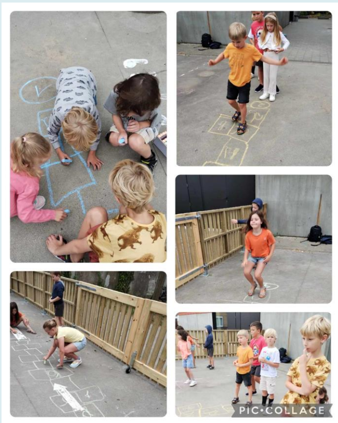
Het tweede leerjaar oefent het alfabet aan de hand van een hinkelspel.

Leren schrijven doen we stap voor stap, van groot naar klein. We maakten de afgelopen week een grote ster, een vlinder en een schooltas met schrijfpatronen.